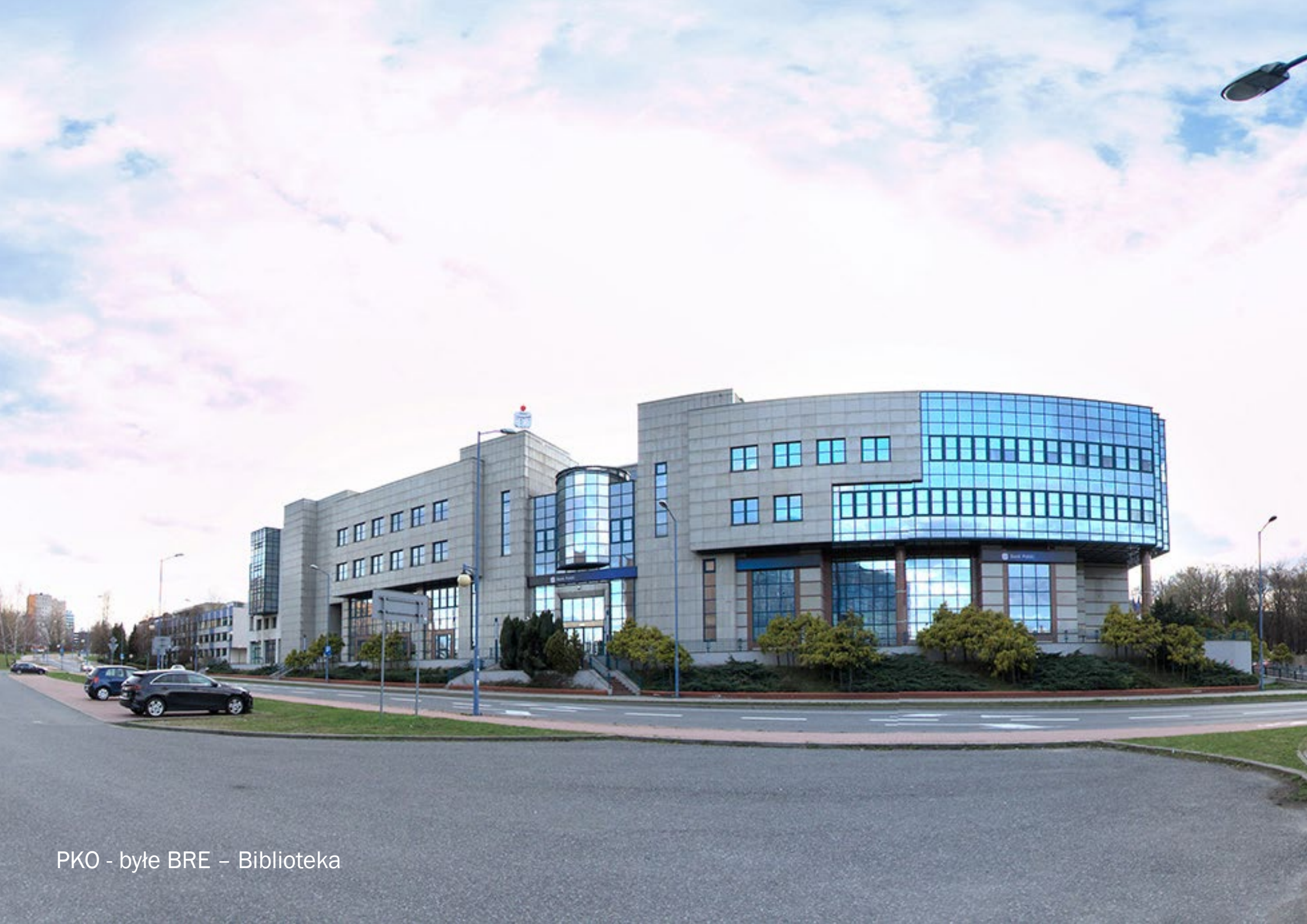
PKO - byłe BRE – Biblioteka