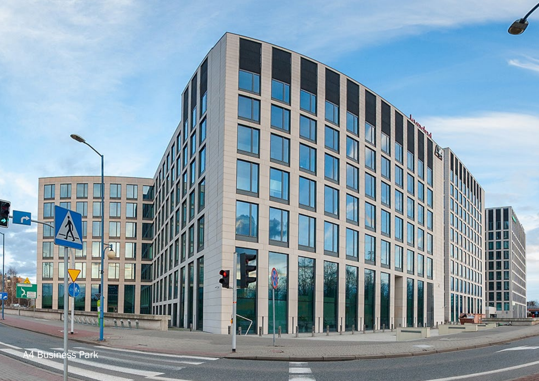
A4 Business Park