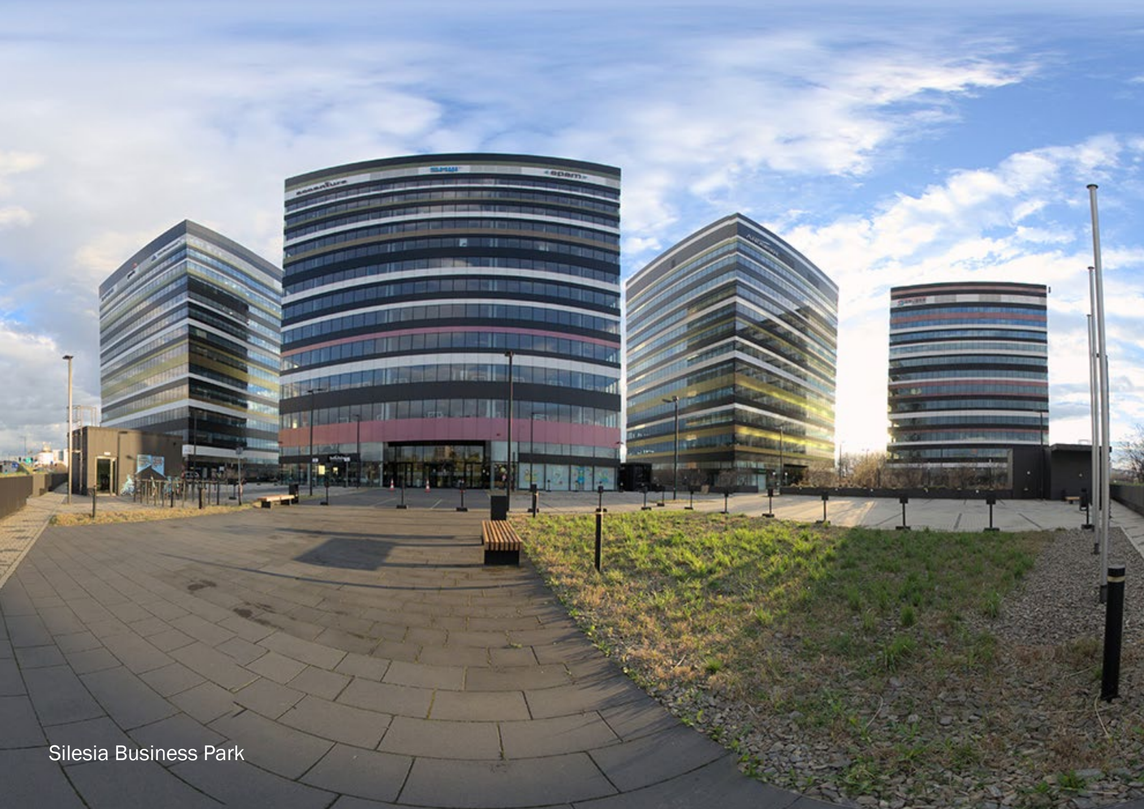
Silesia Business Park