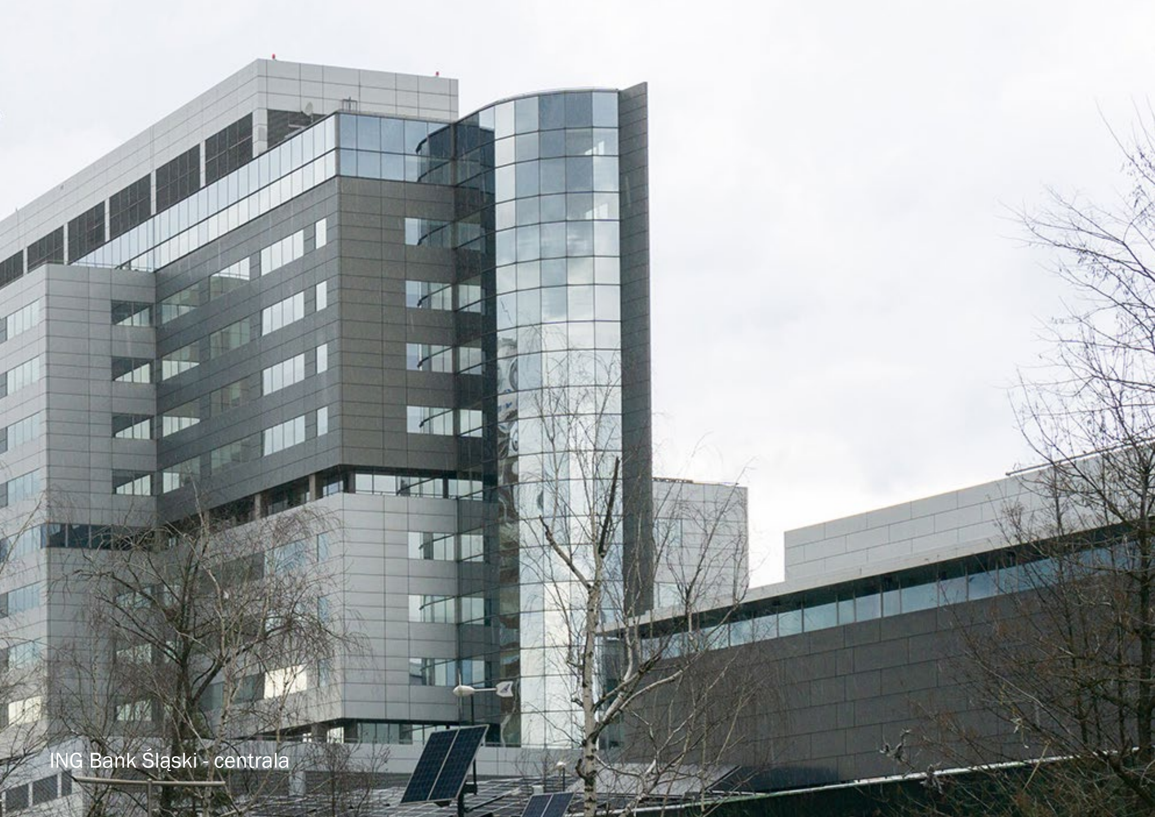
ING Bank Śląski - centrala