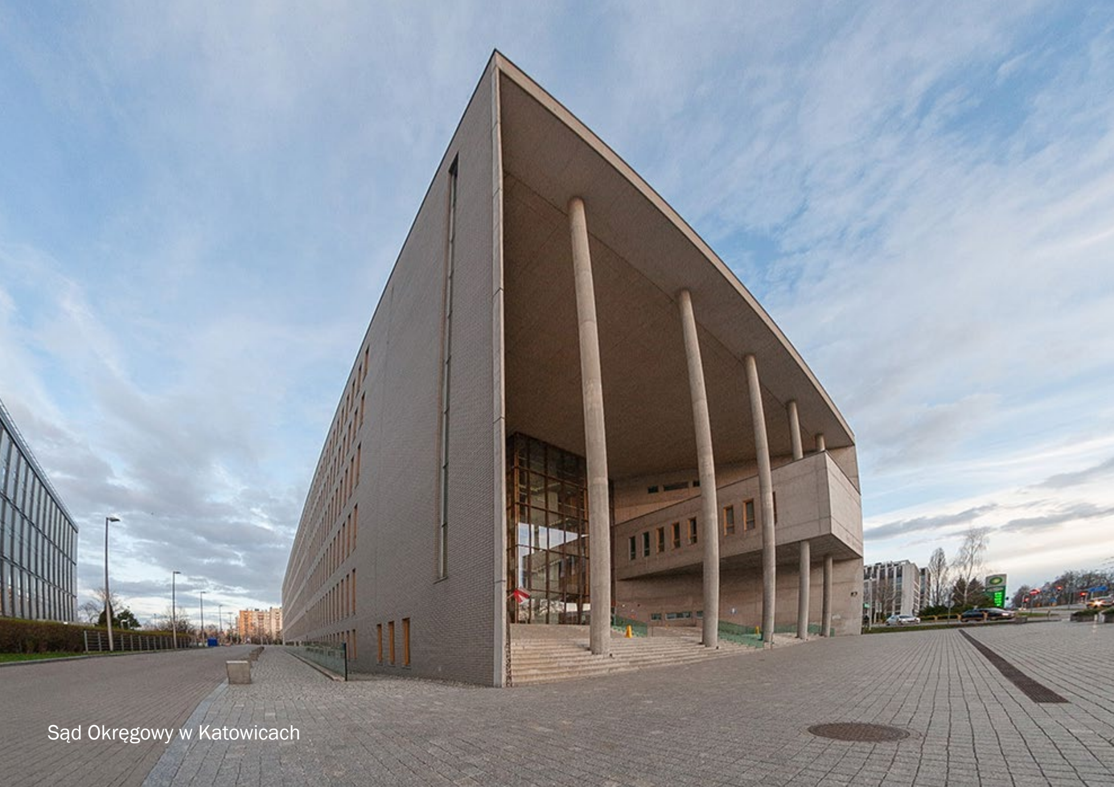
Sąd Okręgowy w Katowicach