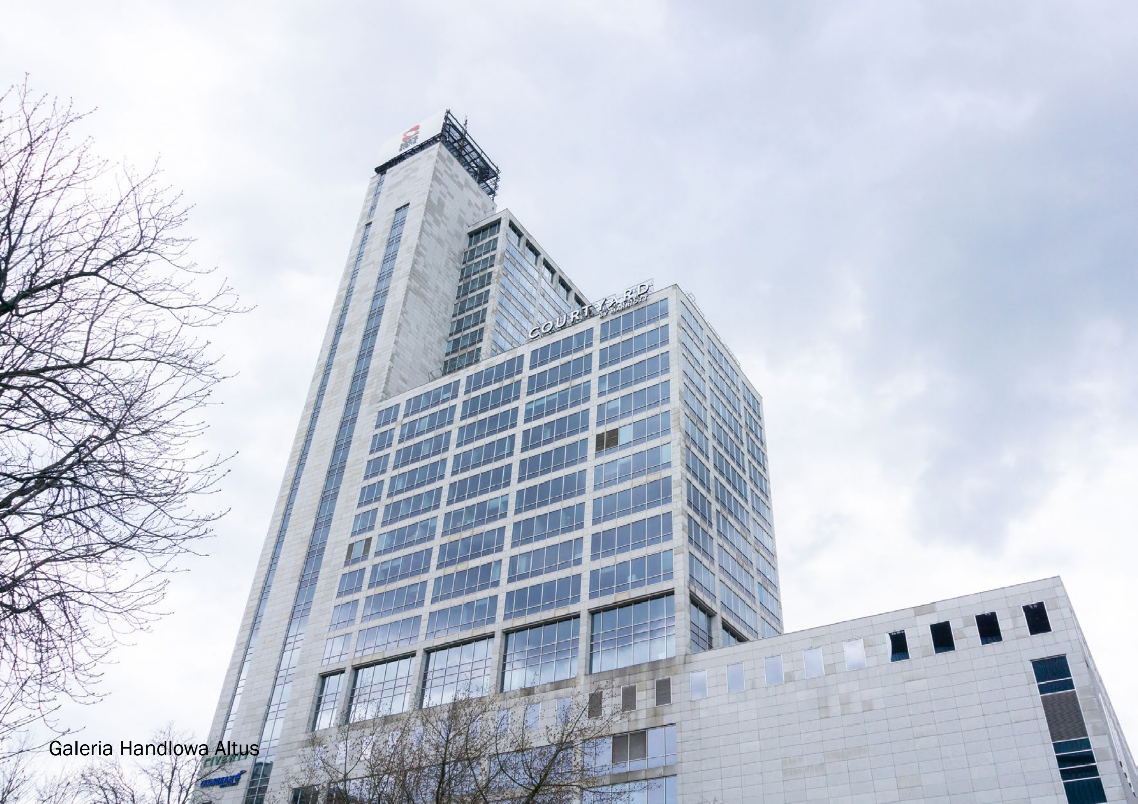
Galeria Handlowa Altus